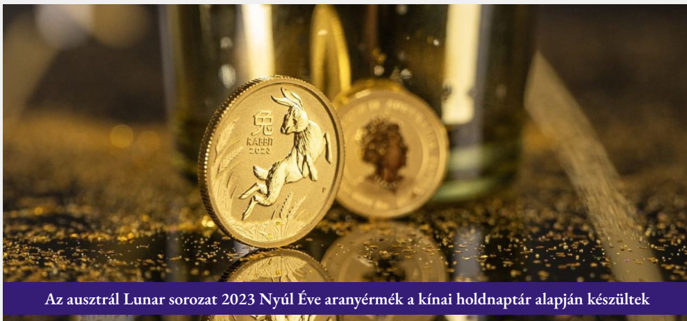
Az ausztrál Lunar sorozat 2023 Nyúl Éve aranyérmék a kínai holdnaptár alapján készültek

Feltehetően az év első felében némi nyomás alatt marad az arany árfolyama, figyelembe véve a recesszió és a kamatemelések veszélyét. Ha a Federal Reserve és a többi jegybank idén is kénytelen lesz kamatcsökkentésre kezdeni, az arany az év második felében újra tesztelheti a 2050 dolláros szintet, és potenciálisan új rekordokat állíthat fel. Mivel sok a bizonytalanság a különböző tényezőket illetően, az arany esetében idén is nagy áringadozásokra lehet számítani. Hosszú távon viszont jól látható, hogy a nagyon magas adósságtérhek miatt nem lehet tovább emelni a kamatokat anélkül, hogy az ne okozzon valamikor komoly gazdasági válságot. Ez azt jelenti, hogy elkerülhetetlenül vissza kell térni az alacsony kamatokhoz és a pénznyomtatáshoz a monetáris rendszer működése érdekében, ami hosszú távon az arany árának emelkedését segíti elő.