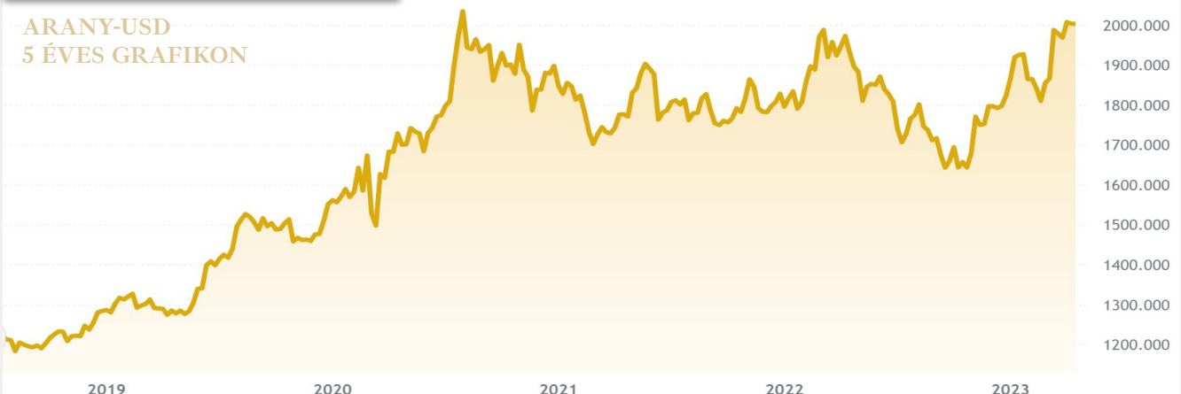
ARANY-USD 5 ÉVES GRAFIKON

szerző: Varga Szabolcs, a Portfolio újságírója